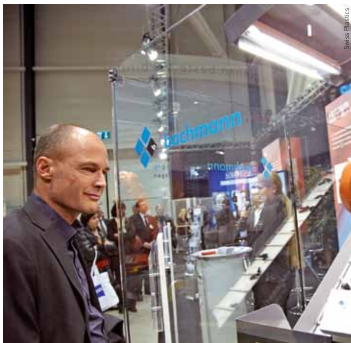
Bertrand Piccard a trouvé un intérêt particulier à l'exposition Swiss Plastics à Lucerne.

Pour promouvoir la plasturgie, un secteur en pleine croissance, notre pays s'organise depuis cinq ans en réseau et en expositions à Fribourg et à Lucerne. La deuxième édition de la Journée technologique de la plasturgie a connu un vif succès le 29 avril dernier à l'Ecole d'ingénieurs et d'architectes de Fribourg.