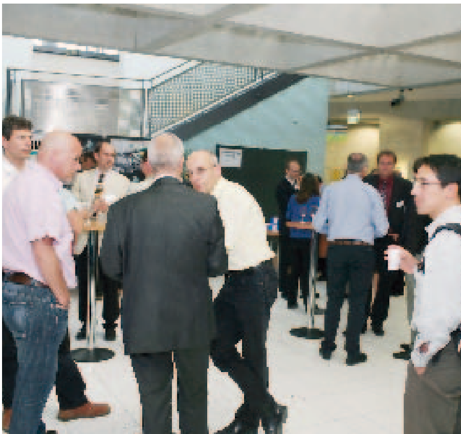
Les Journées technologiques offrent une belle opportunité d'apprentissage et de réseautage.

Le travail du GT innovation a mis en évidence des problématiques communes à plusieurs membres du réseau. Sur cette base, quatre projets collaboratifs ont démarré en 2009.